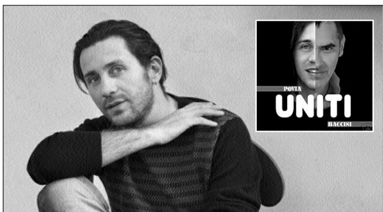
Povia; nel riquadro la copertina del nuovo cd

RIEMPIE le piazze e i piccoli teatri, ha un seguito di circa 30 mila persone, negli ultimi anni, ha dimostrato di non essere solo il cantante de "I bambini fanno oh" o "Vorrei avere il becco".