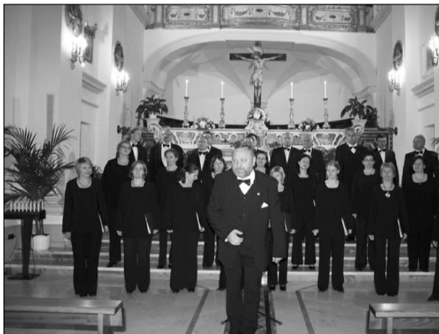
Il coro polacco